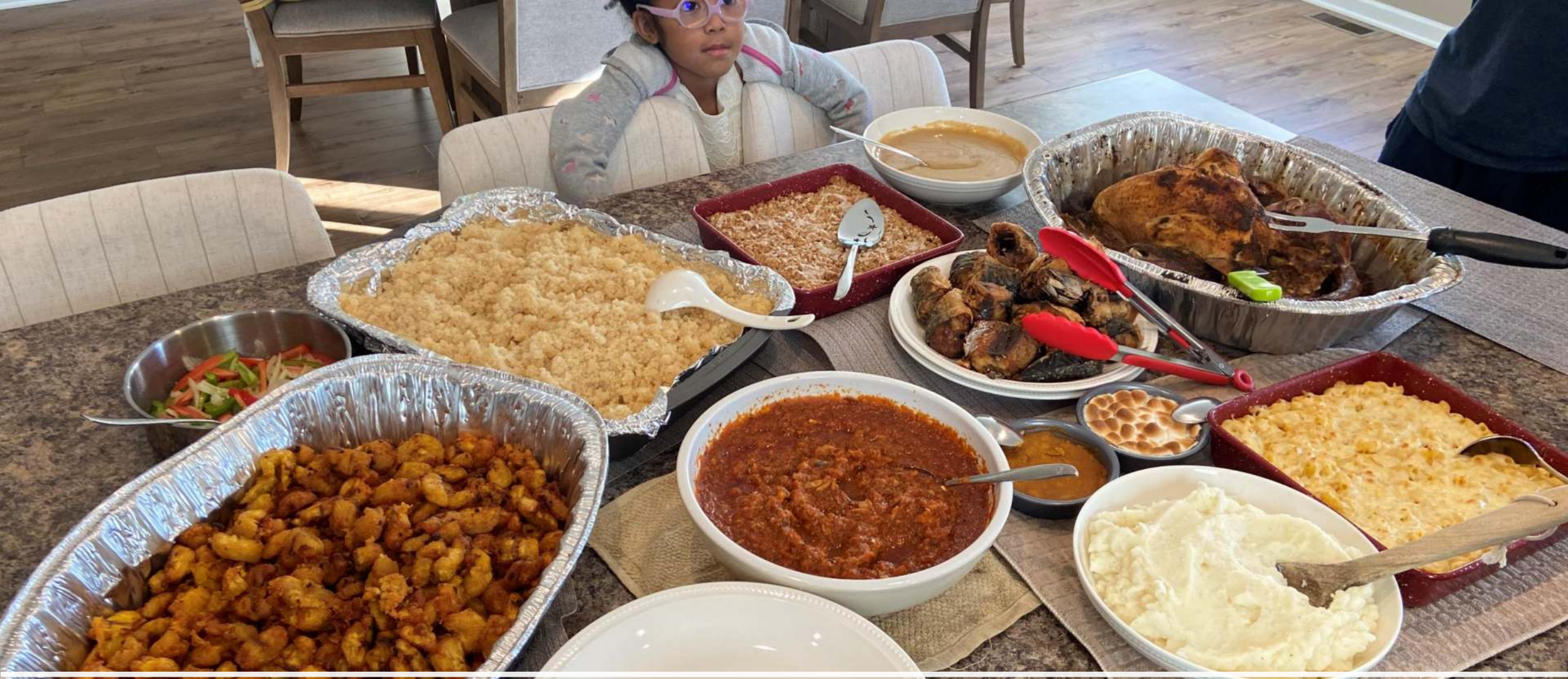
コートジボアール風サンクスギビングディナー