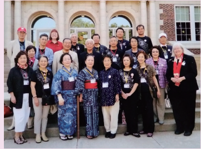
前列右側がグループ氏