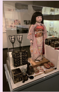
展示の様子とフライヤー

日米親善人形交流95年を記念する『「ミス三重」の展示』がネブラスカ州立大学博物館にて2022年10月まで開催されています。「ミス三重」は、1927年12月に58体の答礼人形とアメリカに渡り、各地巡回の後、翌年の10月26日にネブラスカに到着しました。多くの道具類や子どもたちの手紙などが保管されています。彼女は1988年の「ミス日本」を代表とする19体の里帰りの中の1体として初めて来